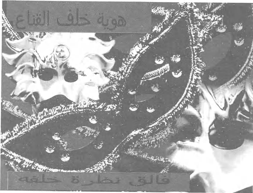
صورة ١١-٤ ألق نظرة خلف القناع